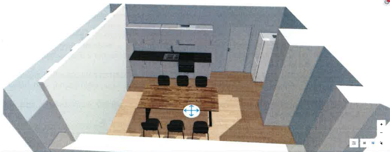
Załącznik nr 2 – rysunki podglądowe pod nową zabudowę aneksu kuchennego