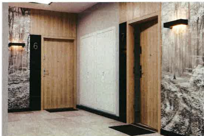
Załącznik nr 1 – drzwi z ozdobnymi panelami bocznymi i górnymi